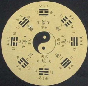
Die kosmische Ordnung: Yin und Yang und der ewige Wandlungsfluss