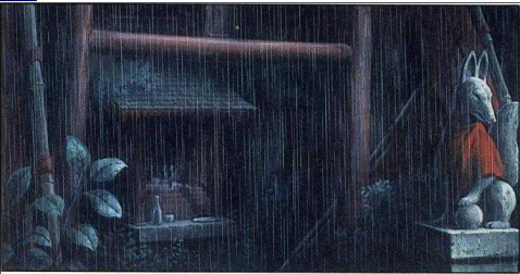
Der Schrein des Inari-Fuchses im Wald