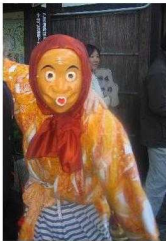
o-kame und hyottoko