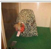
Auch der Roboter ist spezifischer Teil des Ganzen im Schrein. Nach Tanz und Verbeugung holt er uns Information zur kosmischen Ordnung