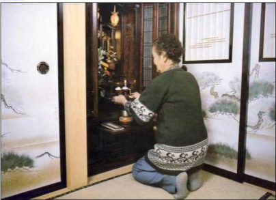
Pflege der Ahnen am Hausaltar