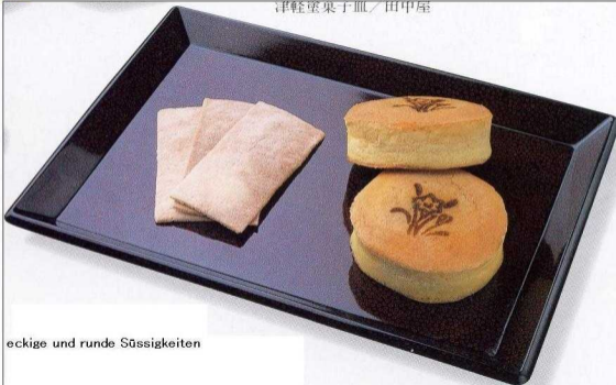
eckige und runde Süßigkeiten