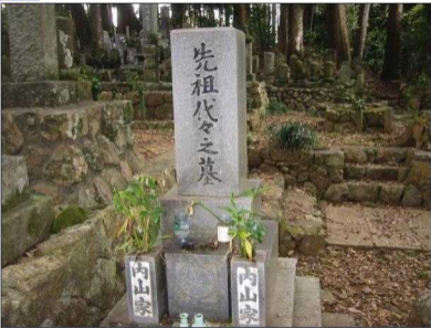
Das Grab des Hauses Uchiyama (Ryōtanji)